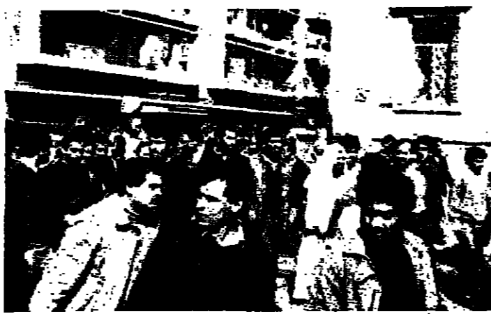
تجمعات في مكان الانفجار

شنتها - الانوار: اغارت الطائرات الحربية الاسرائيلية عند الساعة الواحدة الا عشر دقائق ظهر امس على احد المواقع التابعة للجهة الديمقراطية لتحرير فلسطين عند مدخل بلدة قلبايبا بالقرب من شتورا مما ادى الى تدمير المباني المستهدف وسقوط ثلاثة قتلى وجرح ٢٥ شخصاً. والمعلومات الاضيق بغزارة للطائرات الاسرائيلية. وأوضح مصدر في الجهة الديمقراطية ان الجبهة اخذت مواقعها قبل ثلاثة ايام بسبب ورود معلومات حول حيل مواقع القيمة، والموقع الذي استهدف هو عبارة عن مزرعة وكراج اخلفه العنصر ولم يبق فيه التجارية وشلت حركة السير في المنطقة.